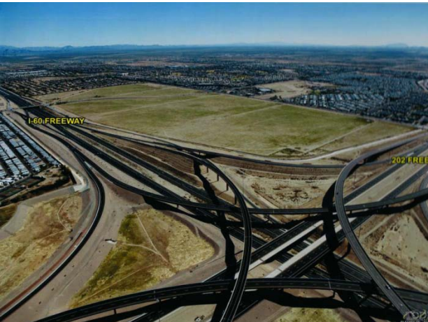
現在の旧名「ザ・クロッシングズ」中心部分航空写真。東西(US60)南北(ループ202)高速道路完成済。 新プロジェクト名(仮称)「ザ・リトルニューヨークアリゾナ」予定地。(残地約40万坪)