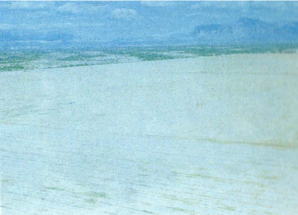
1985年(昭和60年)頃、開発前の砂漠地帯。 (米国、アリゾナ州メサ市)